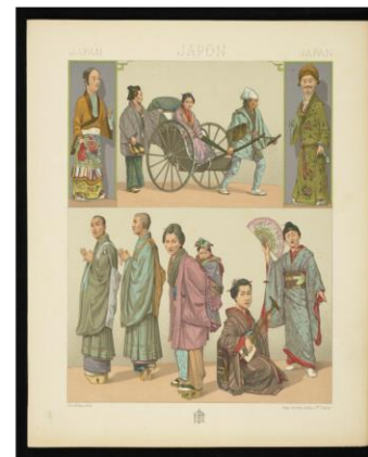
Albert Racines, Costumes civils et religieux: moyen de transport