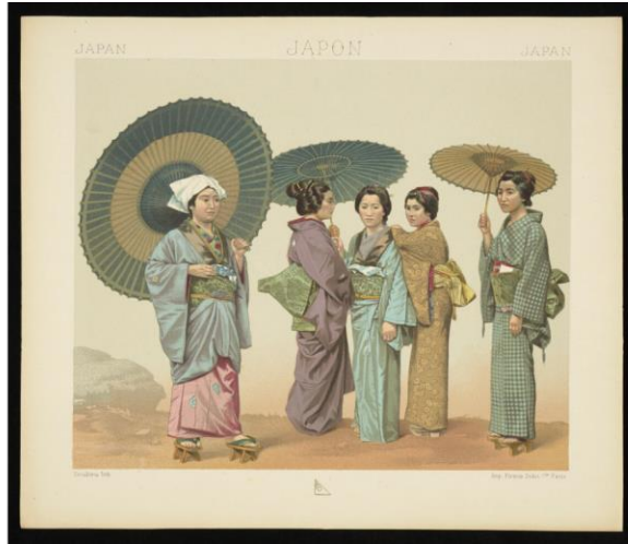
Albert Racines, Costumes des dames japonaises , źródło ilustracji: https://polona.pl/item/costumes-des-dames-japonaises,Njg5Mzl3MTI/2/#info:metadata